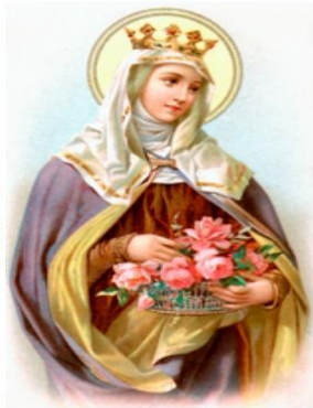
Fête : 17 novembre

Mère des pauvres et des petits, Épouse fidèle, sois Lumière du Christ, nous t'en prions. Reine, tu as déposé ta couronne aux pieds du Seigneur livré pour nos péchés, renonçant à l'orgueil du monde pour être toute à Dieu et au service de toute misère. De Celui qui s'est fait notre Bon Samaritain, tu as reçu cette recommandation : « Va, et toi aussi fais de même » (Luc 10,37), et tu as su trouver les gestes tout simples du lavement des pieds (Jn. 13,15). Par ton intercession, que notre Seigneur et notre Maître renouvelle en nous ses dons précieux de présence et d'attention aux autres et de dépassement de soi dans la petitesse de nos gestes humains. Apprends aux époux à se recevoir comme un don de Dieu l'un pour l'autre, comme tu as su en témoigner avec ton mari jusqu'au pardon. Donne-leur de vivre une fidélité conjugale au-delà de toute espérance, toi qui as porté l'épreuve d'un couple brisé par la mort. La charité que tu pratiquais comme en offrant des roses, demande-la pour nous à notre Dieu : que les enfants, les jeunes, les humbles et les blessés de la vie trouvent dans l'Eglise le geste simple qui construit et guérit. Maintiens en nous le brûlant désir de changer tout ce qui, en nous et par nous, défigure dans l'Eglise le vrai visage du Seigneur. Amen